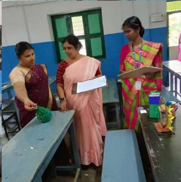
Thamaraikulam, Tamil Nadu, India