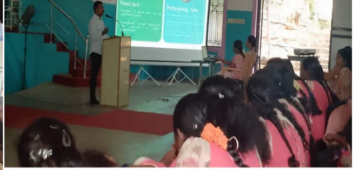
கலைத்துறை நடத்திய சிறப்புச் சொற்பொழிவு